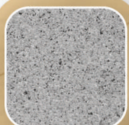
หินทรายล้าง