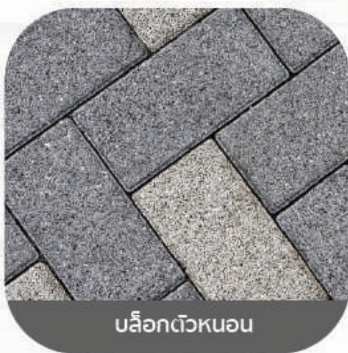
บล็อกตัวหนอน