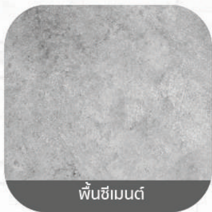
พื้นซีเมนต์