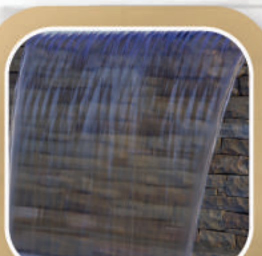
เม่าน้ำตก

ผลิตภัณฑ์เคลือบเงา กันซึม สีใส สูตรน้ำมัน สูตรป้องกันเชื้อรา ตะไคร่น้ำ ทนต่อแสงยูวี