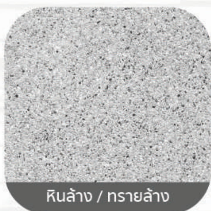
พื้นล้าง / ทราวล้าง