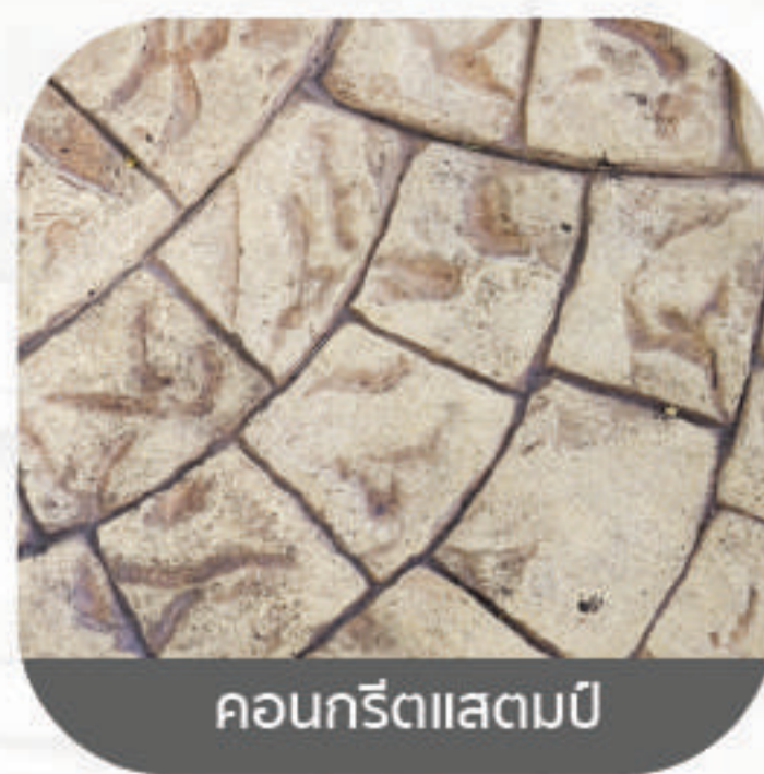
คอนกรีตแสดมปี