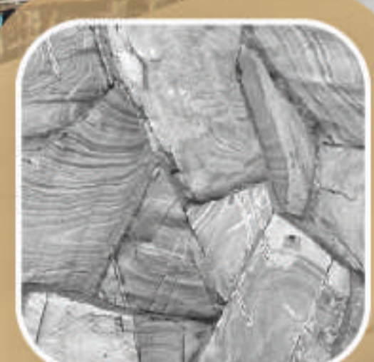
หินธรรมชาติ