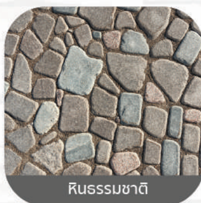
หินธรรมชาติ