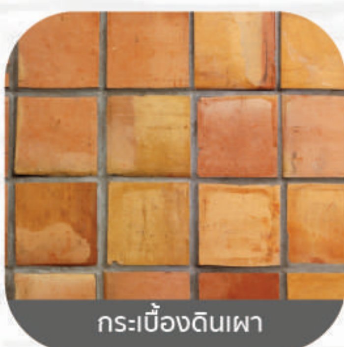
กระเบื้องดินเผา