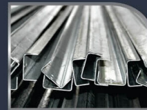
เหล็กกล้าไร้สนิม