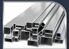
อลูมิเนียม