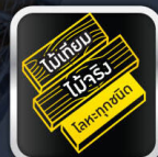
ทาได้หลากหลายพื้นผิว