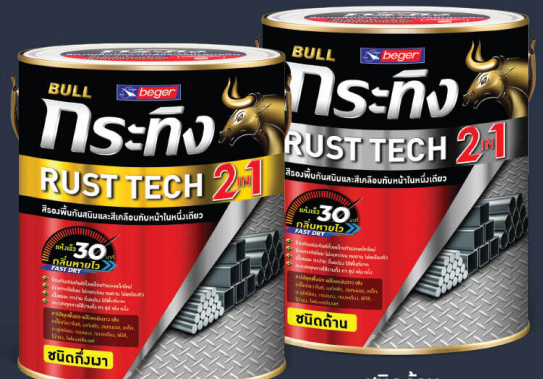
ชนิดทังมา