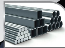
เหล็กชุบซิงค์