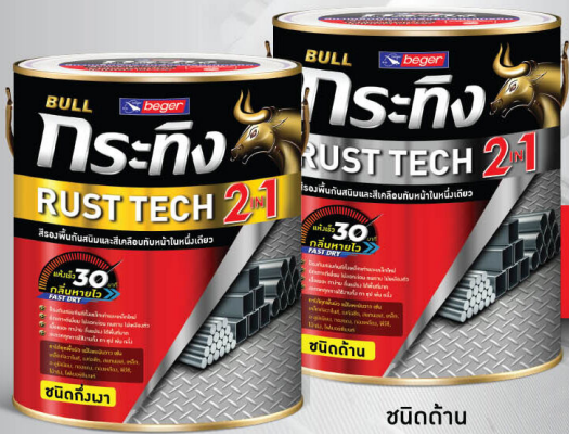
ชนิดทึบมา