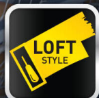
ตกแต่งสไตล์ลอฟท์